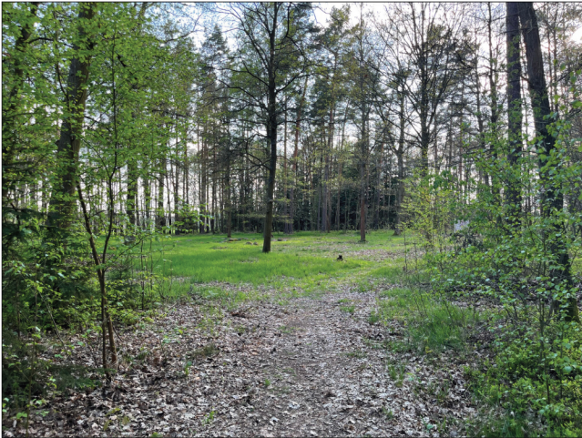
2. Když návštěvník projde lesní stezkou odsilnice směrem ze severovýchodu, otevře se mu pohled na žírovické pohřebiště s dominantním dubem (Quercus robur) uprostřed.