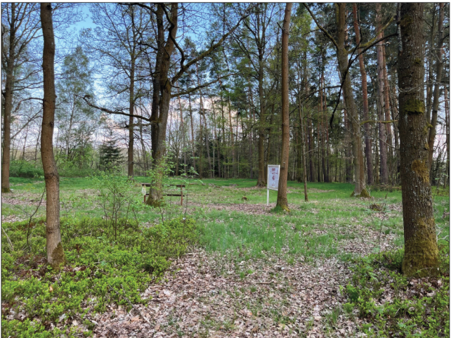
6. Na jejím konci se nachází parcela č. 810, kde bylo již na konci 19. stol. objeveno pravěké pohřebiště z doby bronzové.