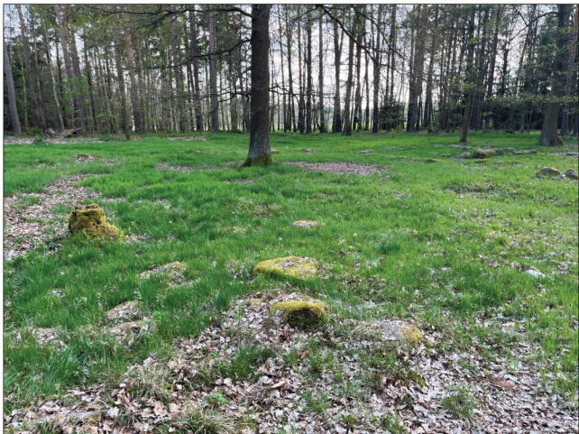
3. Při bližším pohledu si lze všimnout řady větších kamenů, které jsou v současné době porostlé trávou a mechem.