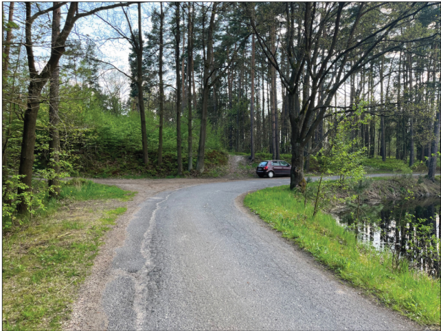
1. Příjezdová cesta směrem od Žírovic. Odtud není patrné, že se v lesním porostu skrývá takový poklad v podobě pravěkého pohřebiště z doby bronzové.