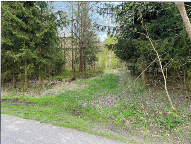
5. Takto vypadá lesní stezka, z které se lze od silnice dostat až k pohřebišti. Je zde i možnost k parkování.