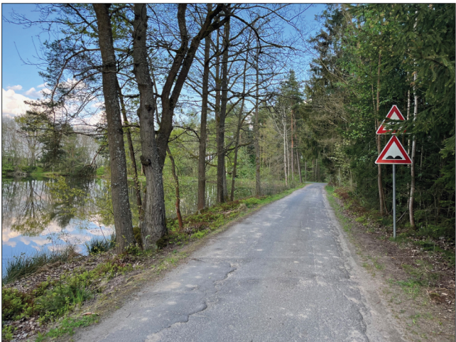
4. Příjezd směrem od západu. Po levé ruce se nachází Nový žírovický rybník, po pravé straně se v lesním porostu skrývá žírovické pohřebiště.